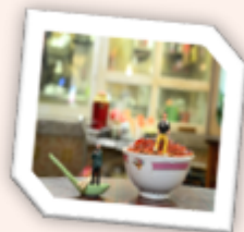
叉燒飯 チャーシュー飯