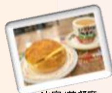
冰室/茶餐廳 チャーチャンテン

九龍城街市には、そこに並ぶ品物のクオリティーに惹かれて有名人も訪れます。映画スターの周潤発(Chow Yun-fat)も、ここで食材を買う姿が時折見かけられます。場内には581軒の店舗が並び、その中には東南アジア産の輸入フルーツを売る店もあります。例えばマンゴーやランブータン、そして最も異国情緒を漂わせているのはドリアンです。強い香りと、クリーミーで甘酸っぱい味わいを持つドリアンは、誰からでも好かれるとは限りませんが、ファンも多く、ドリアンが旬を迎える夏の終わりには、香港で一番のドリアンを求めて多くの人が九龍城街市(Kowloon City Market)を訪れます。